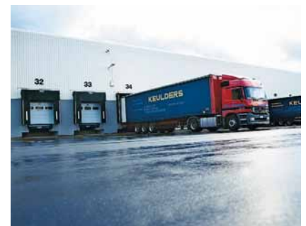
Voor diverse voertuigafmetingen.