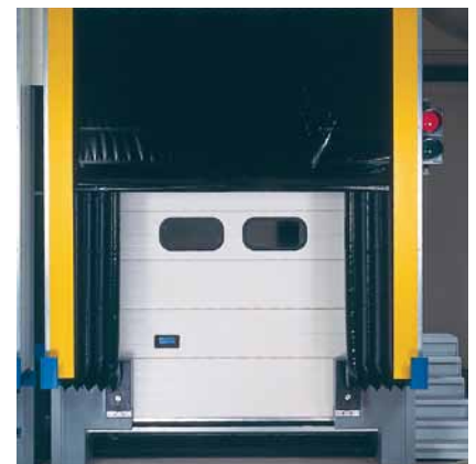
Voor hoge en lage vrachtwagens.