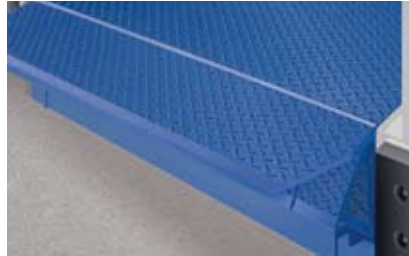
Scharnierende lippen in verschillende uitvoeringen.

De werking van een 610 swingdock is gebaseerd op een elektrohydraulisch scharnierend mechanisme dat de laatste centimeters tussen het gebouw en de laadvloer van het voertuig overbrugt. Als het platform van de dock leveller omhoog wordt gebracht, scharniert de lip naar buiten en belandt vervolgens – wanneer het plat-