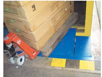
Perronmodel - soepel laden.

De lip van de minidock is uitgevoerd in staal. De vorm van de lip is extreem vlak net als het ontwerp van de achteraansluiting op de dockrand, wat resulteert in een soepeler overgang tussen gebouw en vrachtwagenlaadvloer. De Crawford 613 minidock kan worden aangevuld met een dock shelter zodat de voordelen van een compleet laad- en lossysteem worden verkregen. Een dergelijke oplossing verbetert het laad- en losproces en dus de werkomgeving.