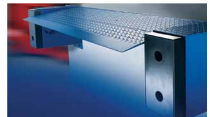
Vlak ontwerp als ergonomische oplossing.