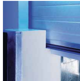
Opening voor de sectionale deur.