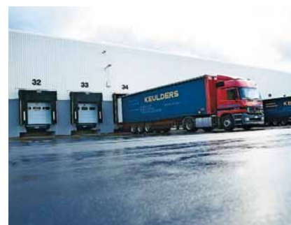
Dla pojazdów o różnych rozmiarach.