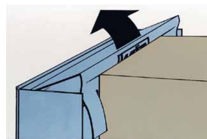
Samonastawna rama dachu.