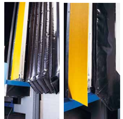
Położenie robocze. Położenie spoczynkowe.